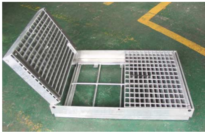
開閉力軽減装置付流雪溝グレーチング