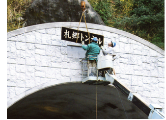
石彫名板 黒御影石