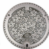
デザインマンホール 鋳鉄