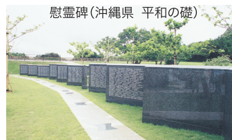
花崗岩(グレー御影石)彫刻