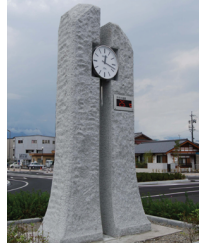
松本市駅西口広場