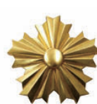
警察・消防署徽章 アルミ鋳物 金箔貼等