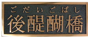
青銅または黄銅鋳物 (JIS H 2202鋳物用銅合金地金) 橋銘板