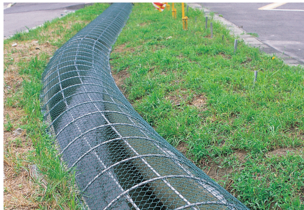
エコプロガードライト