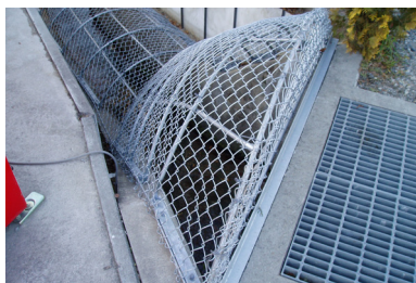
特異な形状の水路にも取付可能で、水路を隙間なくカバーする

エコプロガードに比べて、より軽量かつシンプルな構造でコストパフォーマンスに優れているため、市街地の用水路にも手軽に設置できる。