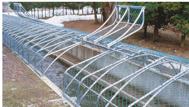
非常時には開口部から消火用に取水できる

シンプルなデザインで、市街地でも自然の中でも景観を損なわない。水路擁壁のコンクリート部分に直接取付できるため、基礎設置のための余分なスペースも不要。