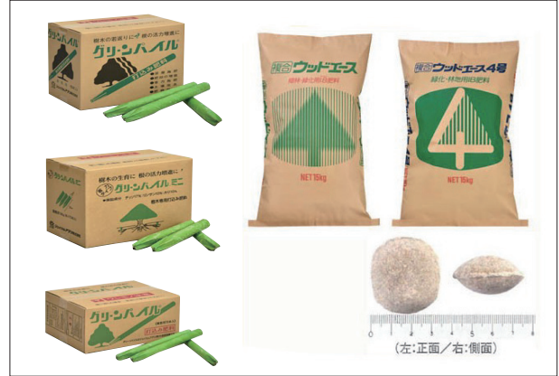
グリーンパイル (左)・ウッドエース (右)