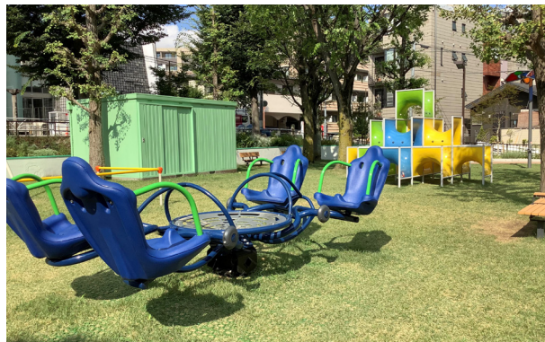
グリーン・ソフター® 施工例 (渋谷区 恵比寿南二公園 2020年施工)