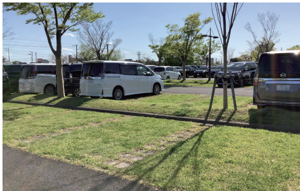
グリーン・オクトパーク® 施工例 (吉野ヶ里遺跡(佐賀県) 芝生駐車場 2000年施工)