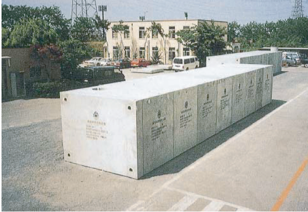
施工組立が素早くできる横置ボックスカルバート型貯水槽

[拠点] 茨城県 北海道 (TEL.0164-22-1711)、東栄コンクリート工業株式会社 山形県 (TEL.023-643-1144)、株式会社セメント工業 福島県 (TEL.0248-76-2819)、旭コンクリート工業株式会社 東京都 (TEL.03-3542-1201)、アズテック株式会社 長野県 (TEL.026-245-6567)、岡山コンクリート工業株式会社 岡山県 (TEL.086-279-0551)、株式会社 マシノ 広島県 (TEL.082-507-2757)、昭和セメント工業株式会社 鳥取県 (TEL.0853-23-4560)、株式会社 開発 香川県 (TEL.0875-25-4131)、九州中川ヒューム管工業株式会社 宮崎県 (TEL.0985-73-1511)、東洋コンクリート株式会社 沖縄県 (TEL.098-945-2762)