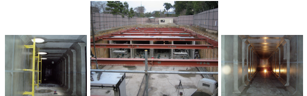
国内最大の1500m 3 耐震性貯水槽 外寸法：縦40.2m、横13.74m、高さ3.78m