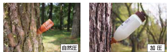
自然圧と加圧、施工状況にあわせて2つの注入方法が選べる。