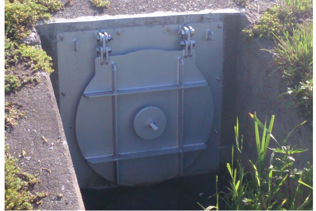
アンカー式ヒュームフラップ