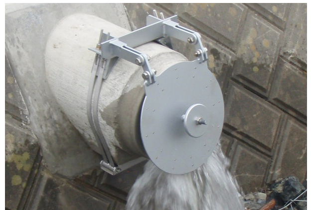
重圧管用フラップゲート