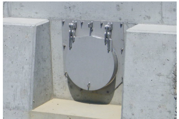
港湾型ヒュームフラップ