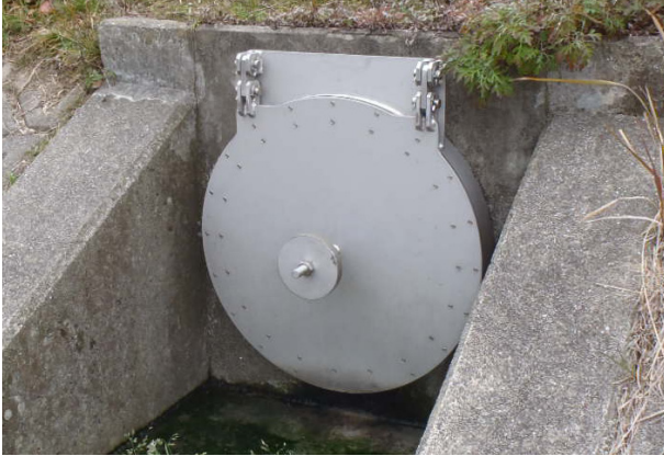
バンド式ヒュームフラップ

[拠点] 仙台営業所(宮城県仙台市、TEL.022-355-2046、FAX.022-355-2047)、関西営業所(兵庫県姫路市、TEL.079-289-5815、FAX.079-289-5816)、岡山営業所(岡山県岡山市、TEL.086-270-3401、FAX.086-270-3403)