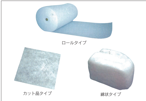
ハイセパーレ 製品写真

[拠点] 大阪支店 (〒530-6108 大阪府大阪市北区中之島3-3-23、TEL.06-6448-6101、FAX.06-6448-6108)、名古屋支店 (〒450-8561 愛知県名古屋市中村区名駅4-4-10、TEL.052-583-5700、FAX.052-583-6001)