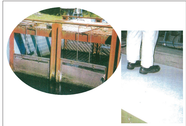
設置例（廃水濾過、床面の油吸着）