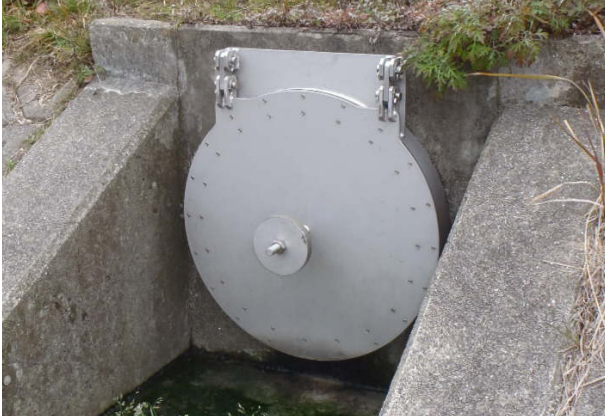
バンド式ヒュームフラップ

[拠点] 仙台営業所(宮城県仙台市、TEL.022-355-2046、FAX.022-355-2047)、関西営業所(兵庫県姫路市、TEL.079-289-5815、FAX.079-289-5816)、岡山営業所(岡山県岡山市、TEL.086-270-3401、FAX.086-270-3403)