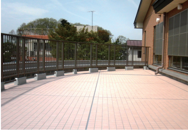
施工例（養護施設屋上フェンス工事）

〒306-0128 茨城県古河市上片田1272-8 TEL 0280-76-4233 FAX 0280-76-4445 URL https://polymer-block.com/ mail polymer@dreams.ne.jp