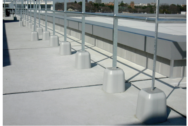
施工例（都内高校屋上フェンス工事）