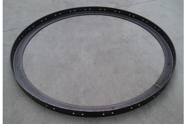
穴あき補強リング (Uボルト工法) ※平鋼 可