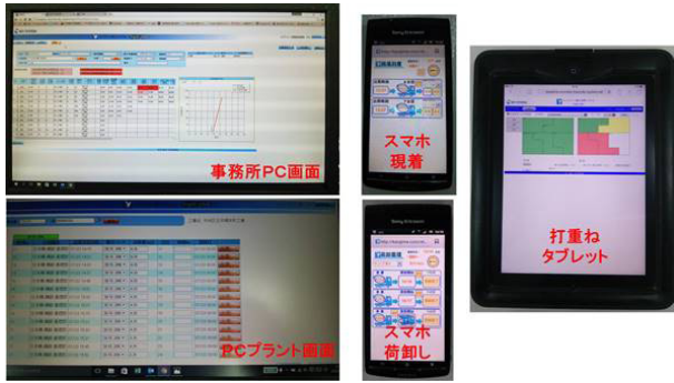
担当ごとにわかりやすいユーザー画面が表示される