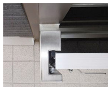
④レールとパネルの位置を合わせる