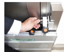
②つまみ2を締め付け、L型金具を建具に押し付ける