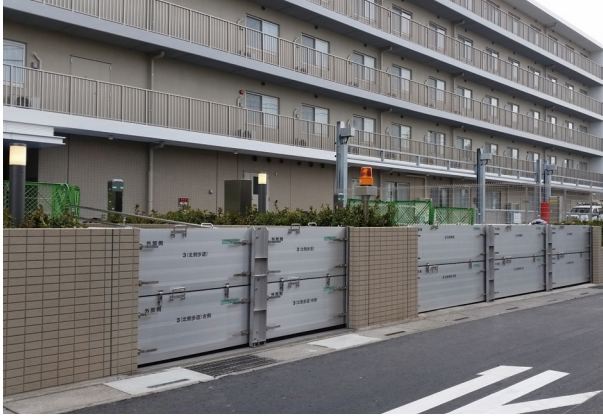
縮付ハンドルタイプ 設置例

[関連企業] 日工株、トンボ工業株、日工電子工業株、日工興産株、日工セック株、 株前川工業所、日工 (上海) 工程機械有限公司