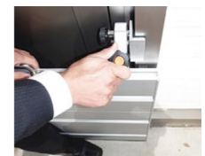
③つまみ3を締め付け、パネルを下に押し付ける