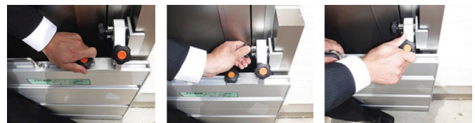
①金具をスライドさせL型金具を建具に押し当て、つまみ1を締める