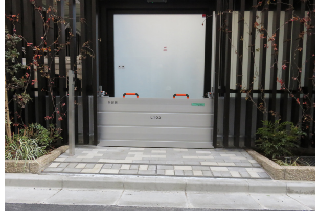
フリータイプ 設置例