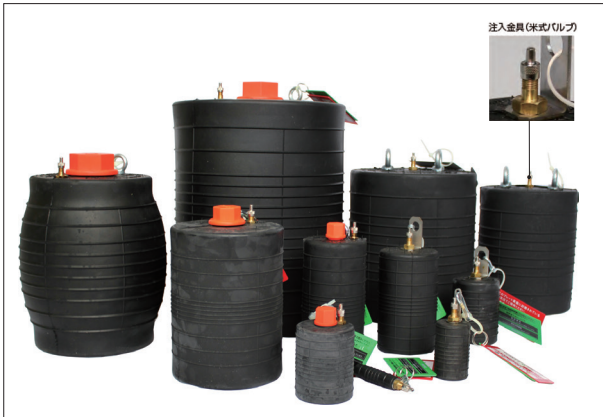
止水ボール ショートタイプ

[拠点] 東北支店 (TEL.019-639-9200)、東京支店 (TEL.042-646-4600)、大阪支店 (TEL.072-883-5151)、九州支店 (TEL.092-504-1335)、中部営業所 (TEL.052-875-8515)、広島営業所 (TEL.082-424-9191)、大阪工場 (TEL.072-885-5433)、大分工場 (TEL.097-521-8200)