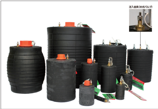
止水ボール ショートタイプ

[拠点] 東北支店 (TEL.019-639-9200)、東京支店 (TEL.042-646-4600)、大阪支店 (TEL.072-883-5151)、九州支店 (TEL.092-504-1335)、中部営業所 (TEL.052-875-8515)、広島営業所 (TEL.082-239-5500)、大阪工場 (TEL.072-885-5433)、大分工場 (TEL.097-521-8200)