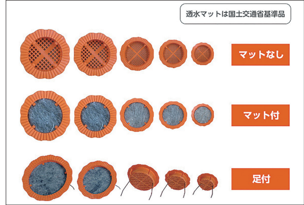
パイプフィルター