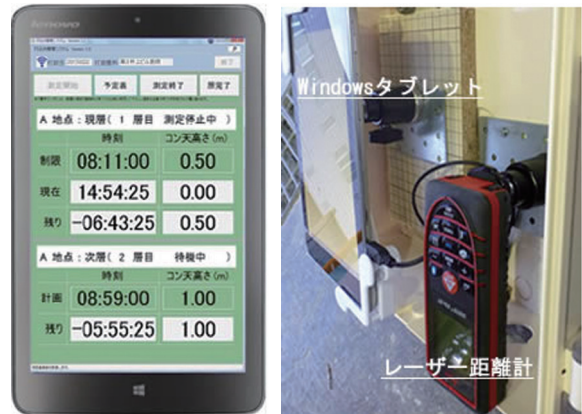
コンクリートの打込み管理システムのイメージ