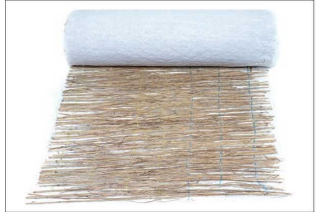
ロンケットキーパー