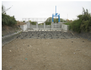
堰堤防護床工（スロープタイプ）

特に効果が高いのは、塩分濃度が高いところ・酸性水PH5以下のところ・腐植土で構成される区間。