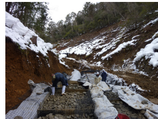
農道整備（スロープタイプ）