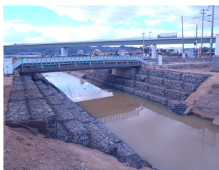
排水路護岸工（カゴタイプ）