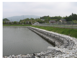
調整池護岸工（カゴタイプ）