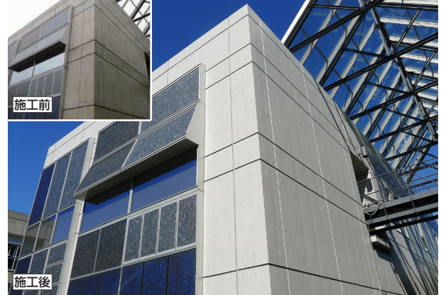
ピアレックスRC工法施工実績（鹿島建設技術研究所、施工2007年）

【拠点】東京営業所（〒111-8520 東京都台東区寿3-14-11 TEL.03-5830-0055）、中部営業所（〒510-8114 三重県三重郡川越町亀崎新田77-568、TEL.059-363-5151）