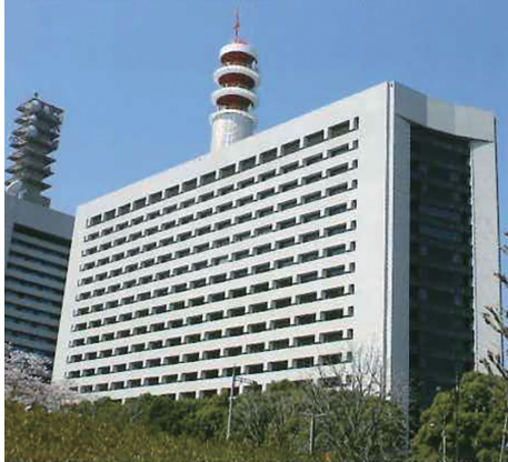
ピュアコート®施工実績（警視庁本部庁舎、施工2017年）