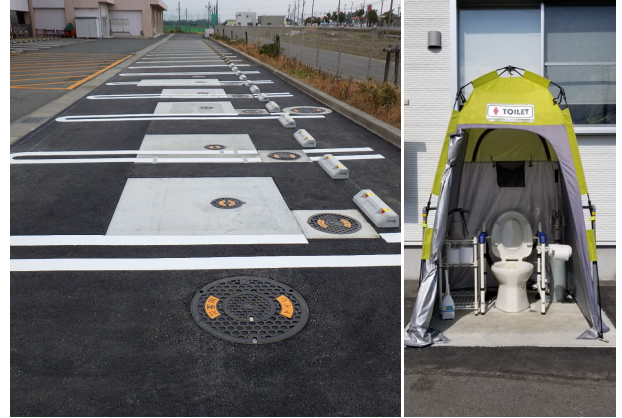
設置前(左)と設置後(右)の状態