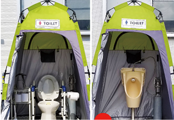
iDotec Toilet (イドテック・トイレ) の外観と内部

[資料請求先] TEL.0120-11-3286 [拠点] 藤沢支店(〒252-0816 神奈川県藤沢市遠藤298-5 TEL.0120-11-3286) 東京支店(〒107-0052 東京都港区赤坂4-13-5 赤坂オフィスハイツ TEL.03-6555-3653)