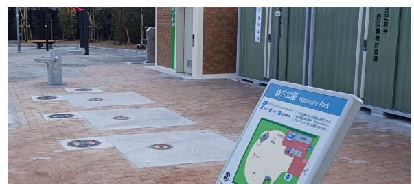
旗の台公園 (東京都品川区)