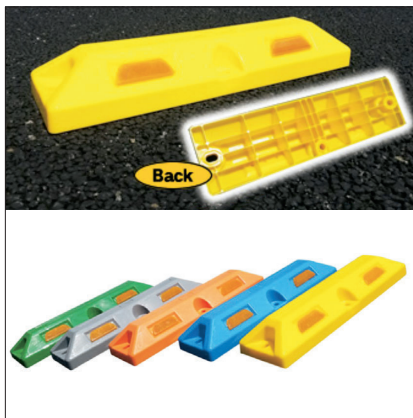
パーキングストップ

〒400-0047 山梨県甲府市徳行3-15-1 TEL 055-269-7864 FAX 055-269-7865 URL http://www.parking-r.jp/ mail sunself@parking-r.jp [資料請求先] TEL.0120-53-9727