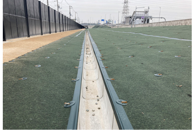
高速道路出入口付近