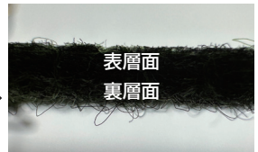
新技術 (表面フラット強化)