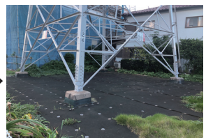
令和5年撮影(11年経過)