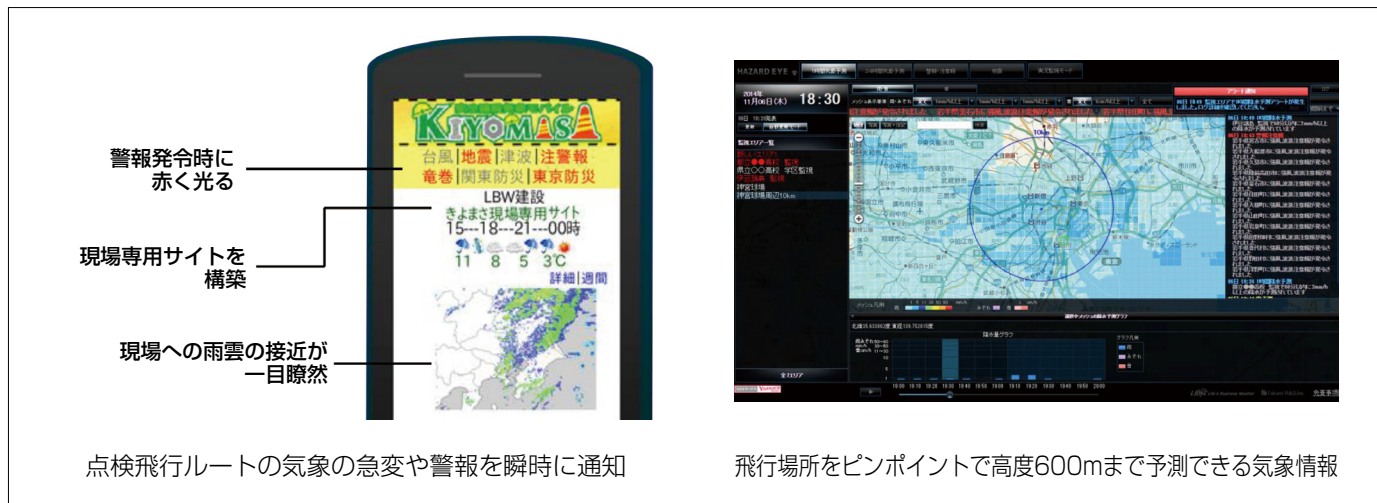
点検飛行ルート of 気象の急変や警報を瞬時に通知