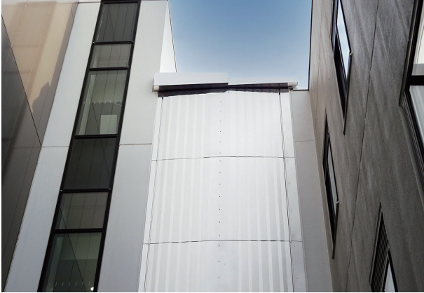
渡り廊下（屋根部・外壁部）

【拠点】東京支店（東京都港区新橋6-9-5、TEL.03-3433-6645）、大阪営業所（大阪市西区西本町1-3-10、TEL.06-7639-5870）、仙台営業所（仙台市青葉区大町1-1-8、TEL.022-214-8088）、福岡営業所（福岡市博多区博多駅前4-8-15、TEL.092-432-2532）