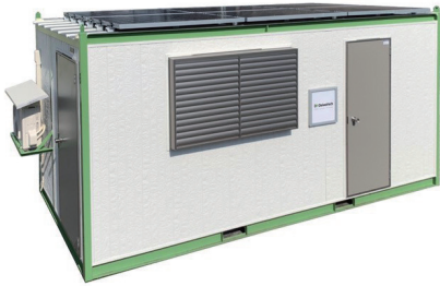
トイレ付ソーラーシステムハウス 「くつろぎ」

〔拠点〕 東京本社、名古屋本店、大阪支店、9営業所 (札幌、盛岡、仙台、埼玉、新潟、金沢、静岡、広島、福岡)、3出張所 (京滋、香川、沖縄)