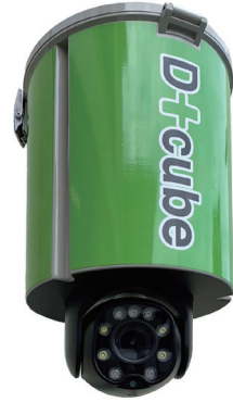
現場監視カメラ D+キューブ