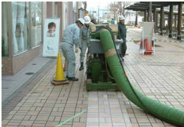
神戸電鉄 岡場駅前

[拠点] 本社統括事業部 (〒599-8101 大阪府堺市東区八下町3丁13 TEL.072-275-5055)、 東京支店 (〒136-0082 東京都江東区新木場3-4-12 TEL.03-3521-8667)