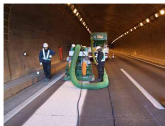
TN ギガショット施工中1列目