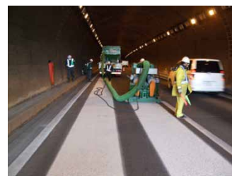
TN ギガショット施工中2列目