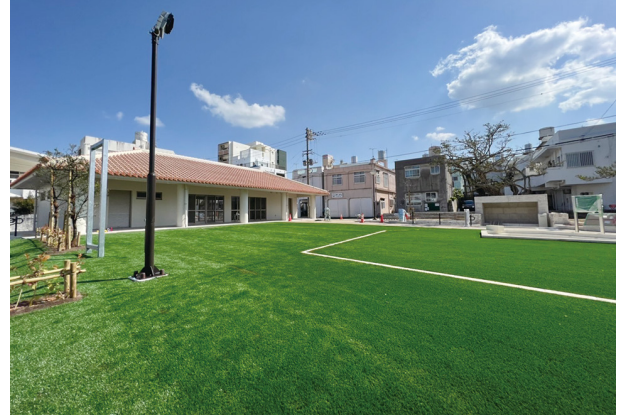
施工事例（親川広場）