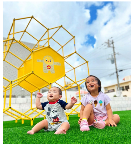
素手・素足でも安心