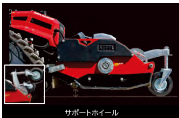
サポートホイール

フレイルモア後方のガイドローラーを宙に浮かして後進でも草刈可能。斜面の草刈に便利