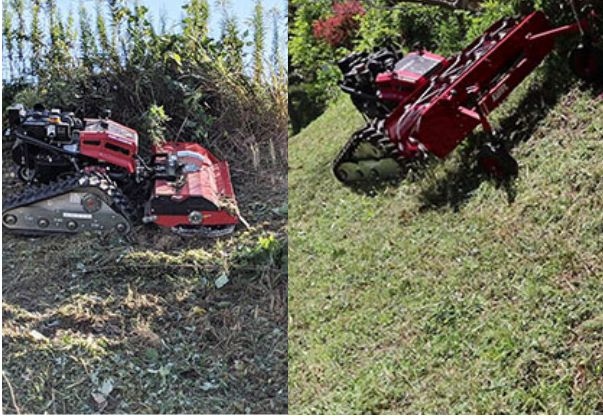
草刈機および集草機