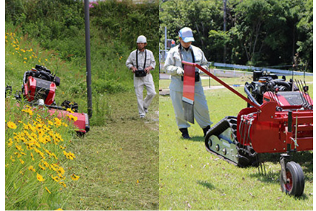
遠隔操作による作業風景