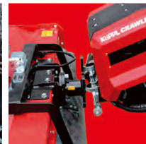
④ 本体を前傾させてひっかけを外す。