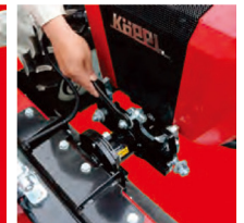
② 3か所ナットを緩めてボルトを外へ上げる