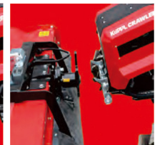
⑤ 本体を後進させる