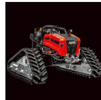
CRAWLER ベースユニット(本体)