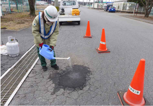
αミックスの施工の様子