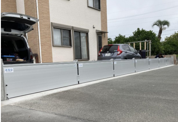
一戸建て住宅への設置例（間口14m）