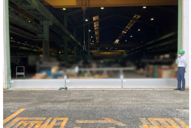
工場大扉への設置例（間口8m）