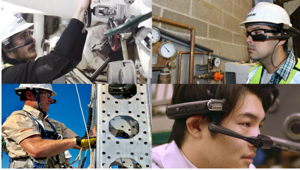
スマートグラスクラウド現場側の利用イメージ