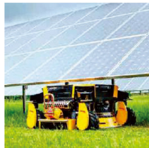
AWD駆動で軽量ボディ