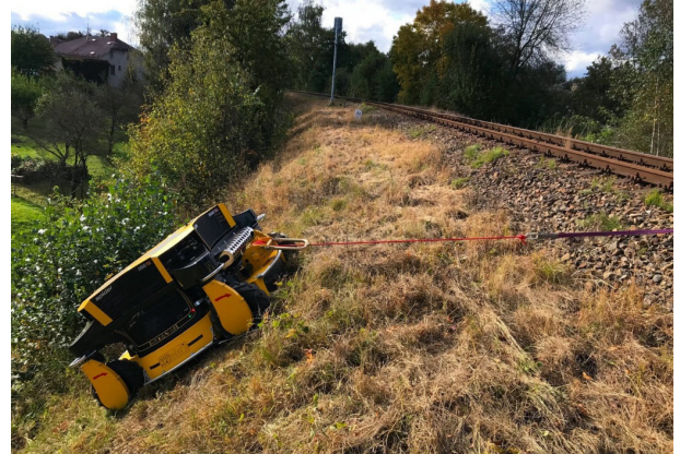
ウインチ併用で2SGS EFIは最大斜度60度まで対応