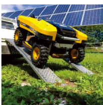
軽トラックで輸送可能 (2SGS EFIを除く)