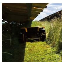
高出力エンジンで 作業生産性向上