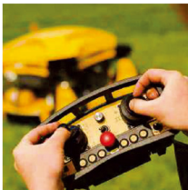
遠隔操作リモコン