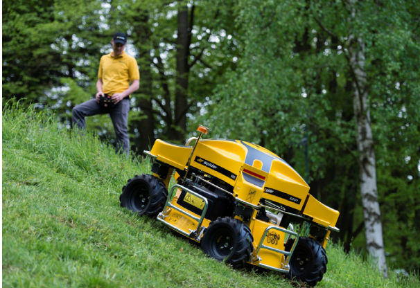
遠隔操作による作業風景