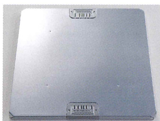
標準パネル PKタイプ