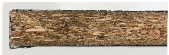
パーティクルボード

窯業系の同社従来製品と比較し36%軽量化。建築物そのものを軽量化することで、トータルコストの削減につながる。