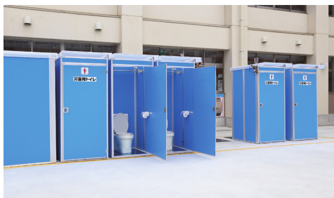
高知市立城西中学校