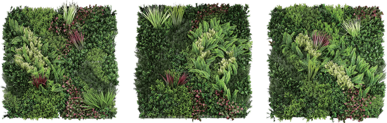
製品写真（左からオリエンタルA・B・C）