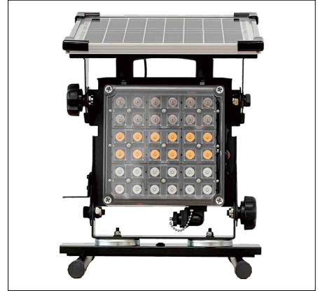
新製品ソーラーピカドラ