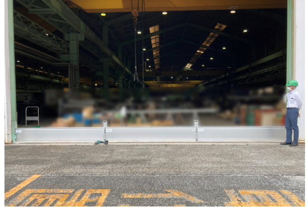
工場大扉への設置例 (間口8m)