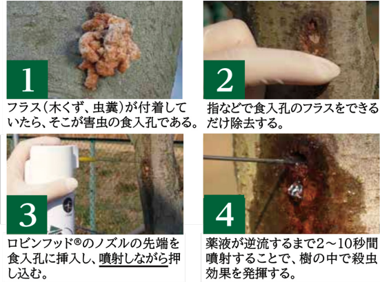
ノズル式処理手順