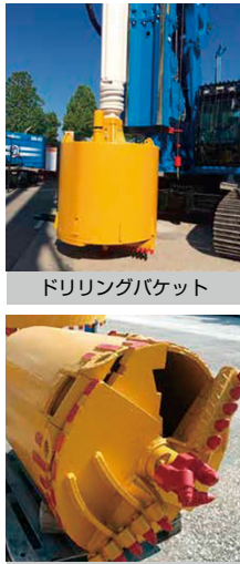
ドリリングバケット