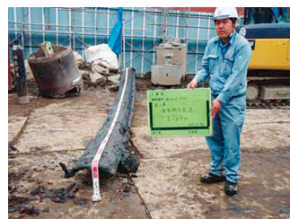
撤去された地下躯体