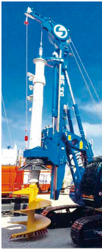
低空頭マスト+オーガー