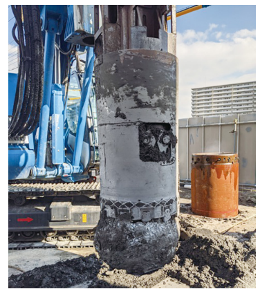
多機能掘削機による場所打ち杭工・地中構造物撤去工