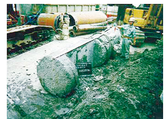
撤去されたシートパイル