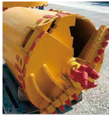
ドリリングバケット