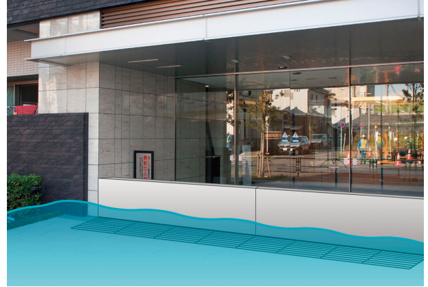
AQUA BLOCK FLOAT 施工例