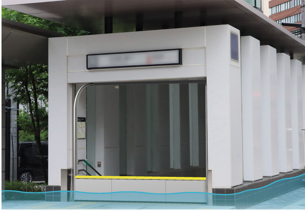
AQUA BLOCK FALL 施工例

【横浜工場】〒223-0051 神奈川県横浜市港北区箕輪町2-10-9 TEL.045-534-5117