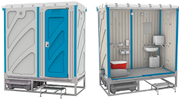
FG快適トイレ製品写真

〒450-0002 愛知県名古屋市中村区名駅5-5-22 名駅DHビル5F TEL 052-433-6235 FAX 052-551-7888 URL https://www.asahi-house.com mail e-honbu@asahi-house.com