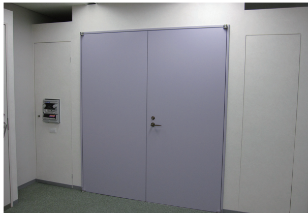
サイレンティイー