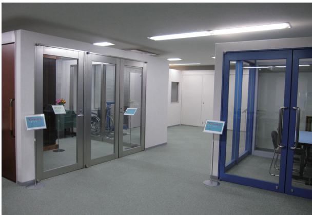
ファイヤーカール

[グループ会社] 株式会社テジマ、株式会社西村工場、株式会社金子商店、和島工業株式会社、株式会社北関東東曲加工センター、株式会社手島製作所、株式会社福田鋼機株式会社、トーホーサッシ株式会社、金秀アルミ工業株式会社、井上鐵工株式会社