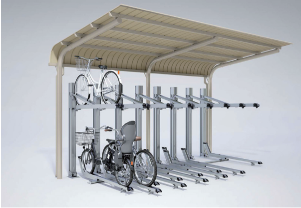
駐輪場屋根+自転車ラック

【拠点】札幌 (TEL.011-881-3121)、東京 (TEL.03-3633-6551)、名古屋 (TEL.0586-77-7561)、大阪 (TEL.06-6392-5556)、仙台 (TEL.022-235-4380)、埼玉 (TEL.048-667-9381)、広島 (TEL.082-294-9181)、福岡 (TEL.092-482-8112)