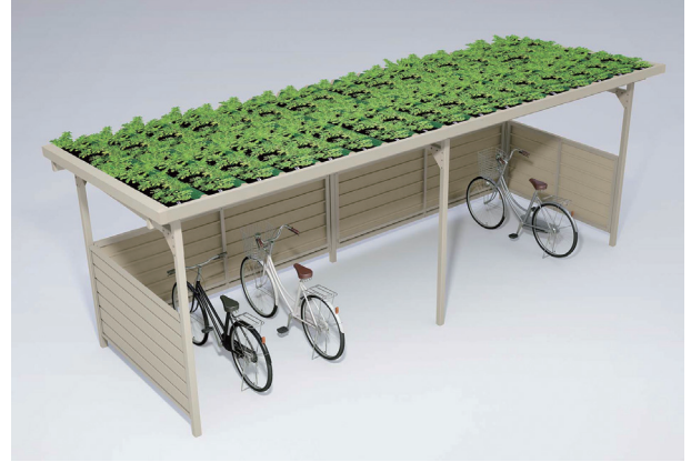
駐輪場屋根 緑化仕様

株式会社ダイケンは、駐輪場設備を総合的に扱うメーカーとして、安全性・快適性など多様な生活様式のニーズにデザインと機能で対応する。