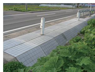
北海道当別町 (旧タイプ仕様)