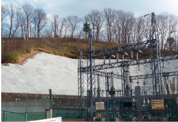
法面での施工事例 (岩手県一関市)