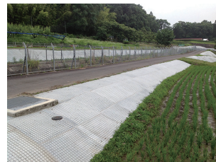
岐阜県美濃加茂市