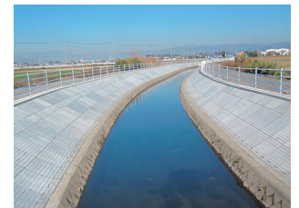
群馬県太田市 (旧タイプ仕様)