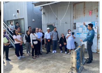
会議参加者が本社工場を見学