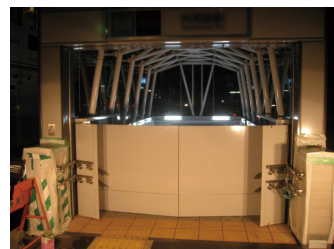
マイターゲートタイプ