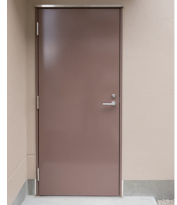
MG止水扉 (止水操作不要) WS-5相当