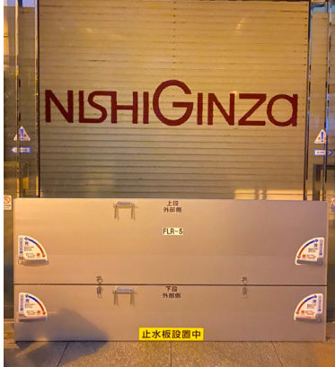
脱着式止水板 (REI) 工事不要 WS-6相当

[拠点] 東京営業所(〒120-0003 東京都足立区東和3-18-13、TEL.03-5856-3538)