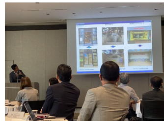
水害マネジメント技術に ついてのプレゼンテーション

2023年9月に福岡市で開催された国連ハビタット福岡本部主催による国際会議で、止水板について発表