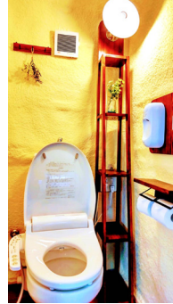
環境を考えコストを抑えたトイレ