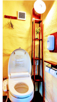
環境を考えコストを抑えたトイレ