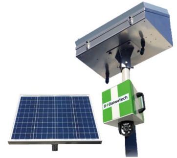
環境改善型BOX・D-Cube 外観