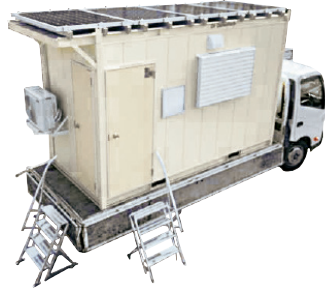
車載型ソーラーシステムハウス 外観