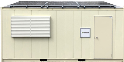
ソーラーシステムハウス外観

【拠点】札幌営業所 (TEL.011-375-7370)、仙台営業所 (TEL.022-395-7389)、東京支店 (TEL.03-6274-6701)、新潟営業所 (TEL.025-384-8617)、静岡支店 (TEL.054-064-3027)、大阪支店 (TEL.06-6398-7483)、広島営業所 (TEL.082-554-5456)、福岡支店 (TEL.092-791-5261)、沖縄出張所 (TEL.098-943-2349)