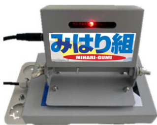
みはり組「ワイヤレス」本体

重機の危険範囲内にいる作業員と運転者の双方に危険を知らせる安全補助装置。現場では、雨や風にさらされる時や、他の重機などのノイズが大きい場合などが想定される。本製品は、これらの条件下でも影響を受けにくい近赤外線を使用。従来の「みはり組」をワイヤレス化し、さらに設置が容易になっただけではなく設置箇所に制限がからず、さまざまな車種・用途に対応できる。また従来の音声機や回転灯も改良し一体化したことにより、音と光のダブルで危険をお知らせすることが可能となった。