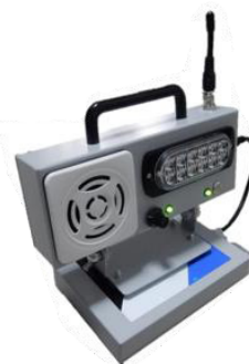
音と光によるダブルチェック