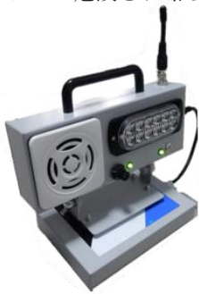
フラッシュ・音声一体型警報装置